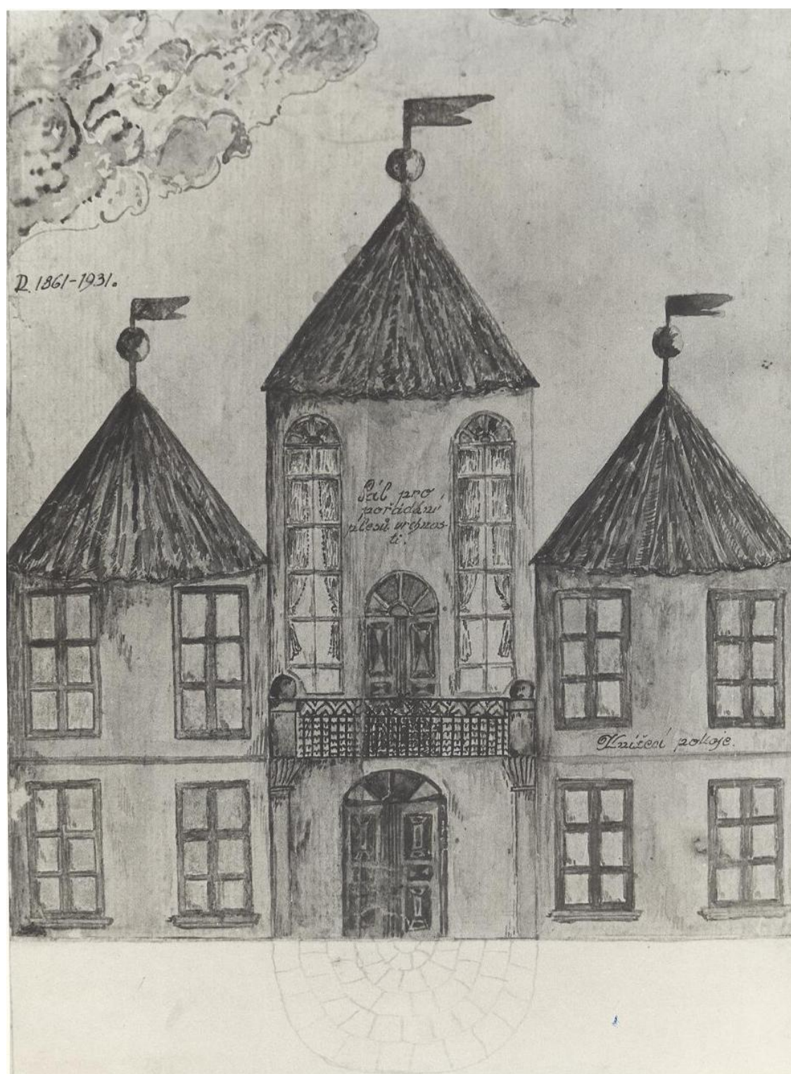
Perokresba „Bílichovského zámku“