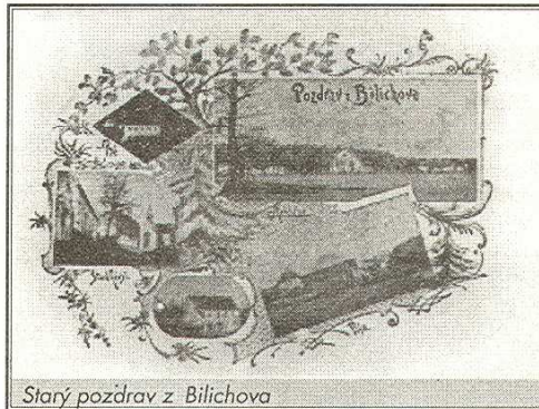
Starý pozdrav z Bilichova

Několik neděl po pohřbu starcově pes zce-