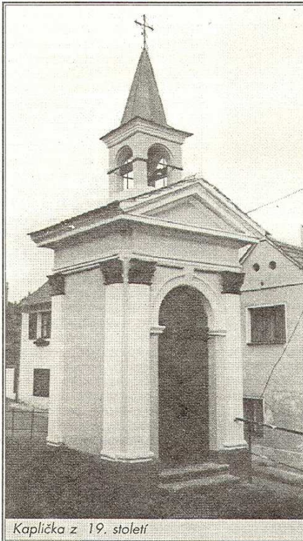
Kaplička z 19. století

Tolik zatím z historie obce Bilichov Libor Dobner